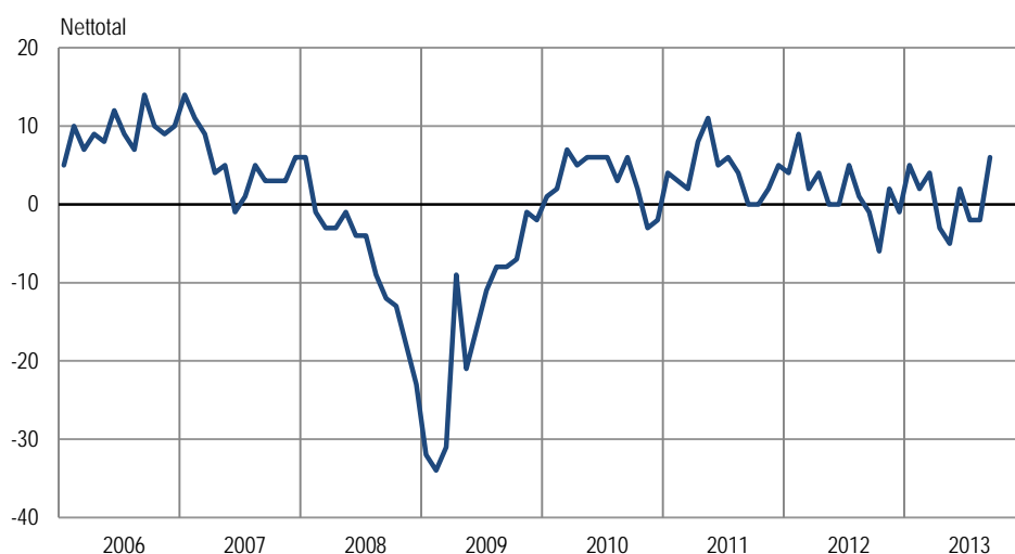
Sammensat konjunkturindikator for industri, sæsonkorrigeret

Anm.: Den sammensatte konjunkturindikator er en sammenvejning af forventet produktion, vurderet ordrebeholdning og vurderede færdigvarelagre.