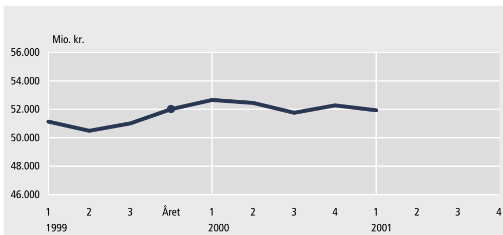
Figur 2. Kommunernes og amternes langfristede gæld ultimo kvartalet

Kommunernes og amternes langfristede gæld faldt i 1. kvartal 2001 med 0,3 mia. kr. til i alt 51,9 mia. kr., jf. tabellen. Den udenlandske gæld var 9,6 mia. kr.