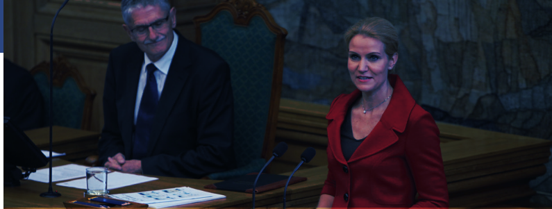
Helle Thorning-Schmidt blev i 2011 Danmarks første kvindelige statsminister.