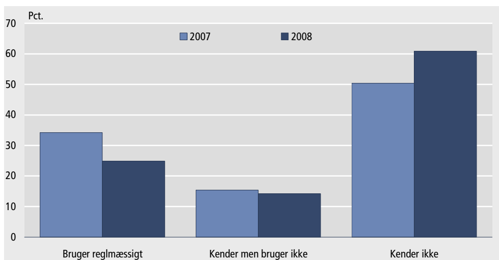
Figur 3. Kendskab til www.statistikbanken.dk

Når vi stiller spørgsmålet, skyldes det en forventning om, at brugerne ikke ser de to systemer som adskilte. I kommentarfelterne er det normalt, at deltagerne kommenterer både på Statistikbank og hjemmeside. Svarene i 2006 og 2007 er fuldstændigt ens, men i 2008 stiger andelen af personer der har svaret, at de ikke kender Statistikbanken. Samtidigt falder andelen af personer der har svaret at de bruger Statistikbanken regelmæssigt.