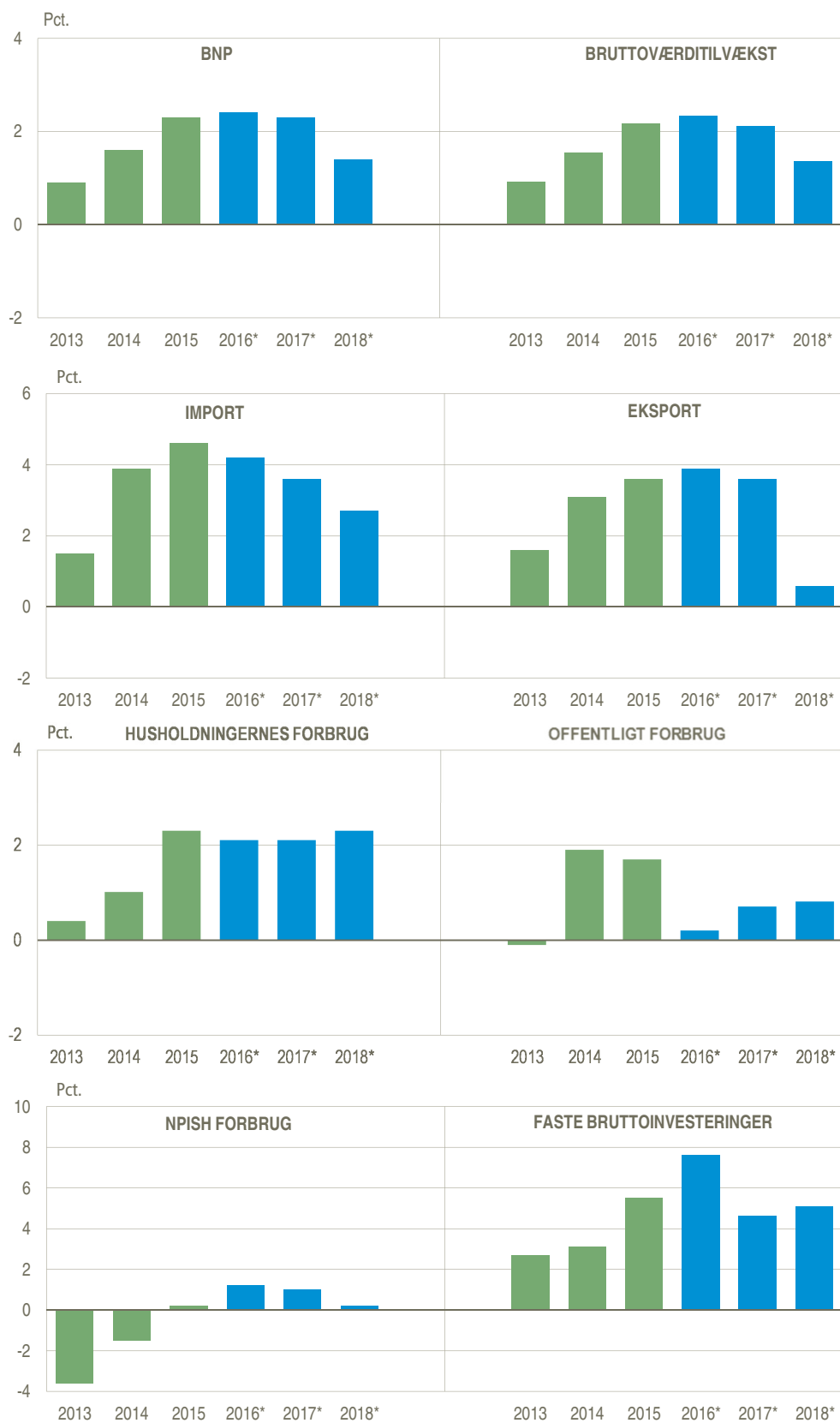
Figur 3. Årlig realvækst