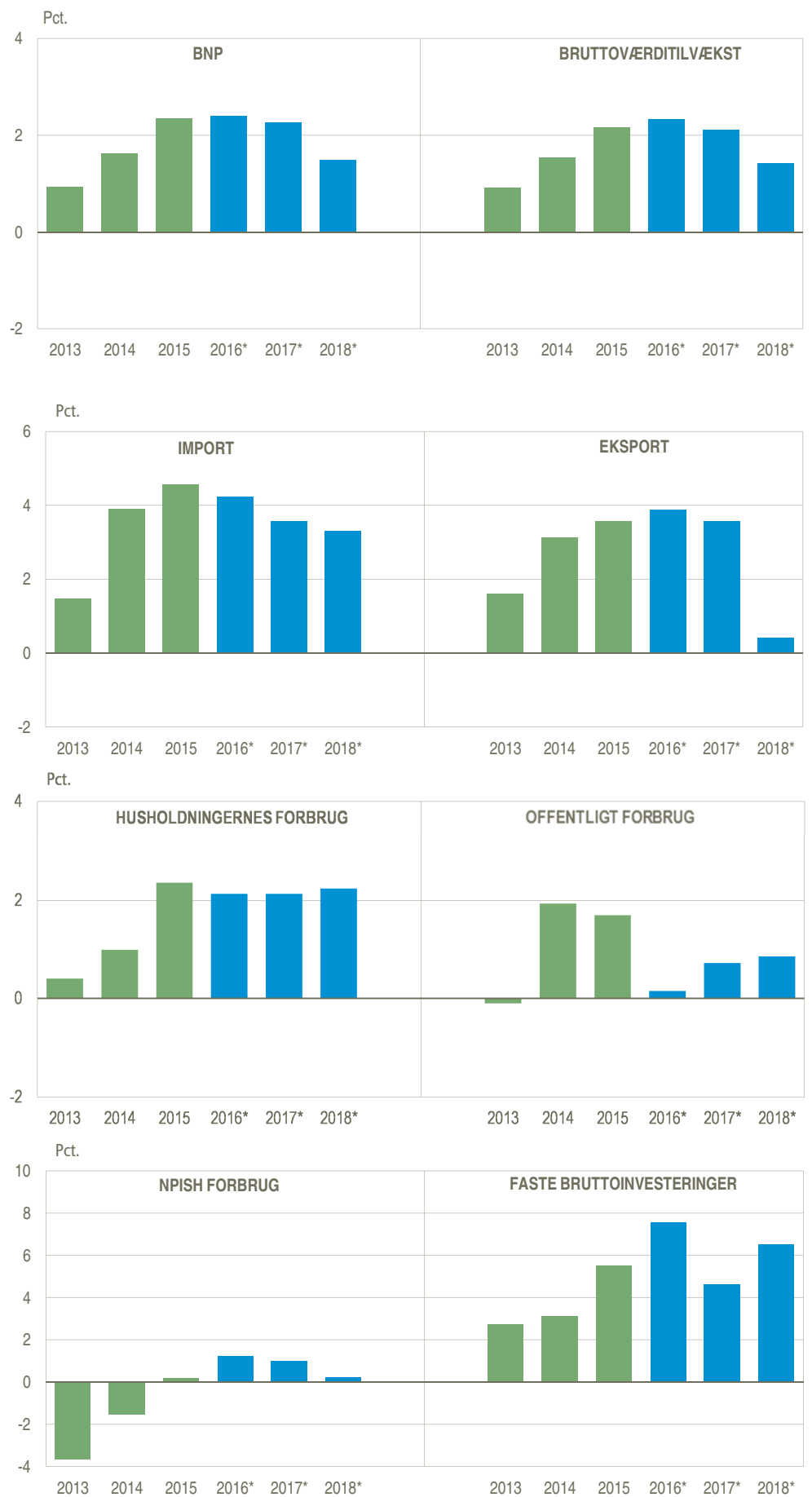
Figur 2. Årlig realvækst