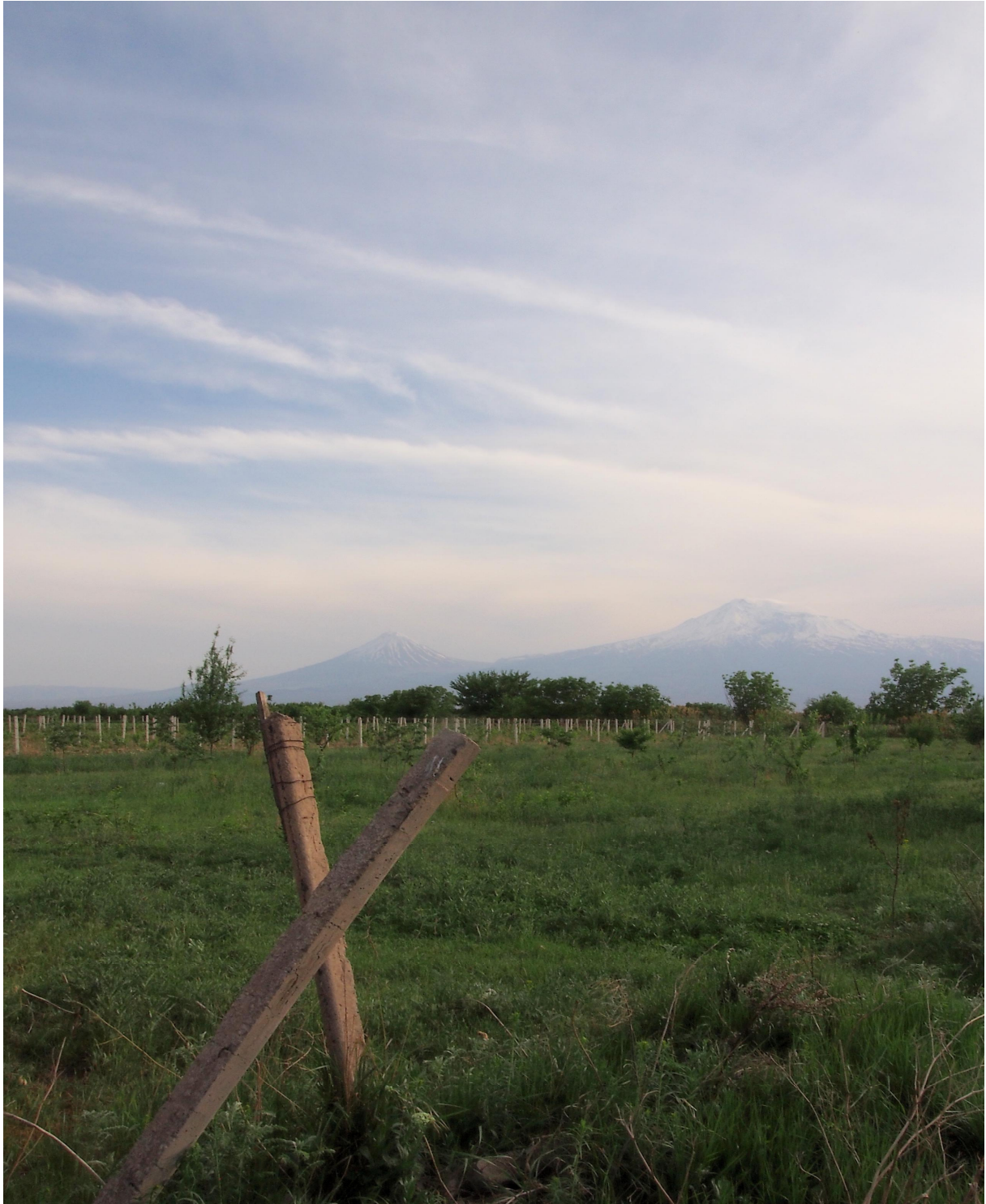
Արարատ (5,165 ծովի մակարդակից բարձր) և Միս (3,896 մետր ).